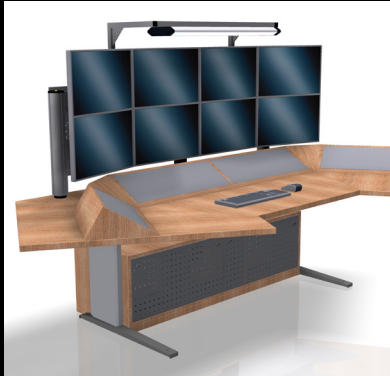
Anpassung an Corporate Design. Adaption to corporate design.

Ob Sonderformen, Farbvarianten oder Zubehör - Wir entwickeln für Sie die richtige Lösung. Whether custom forms, colors or accessories - We design the right solution for you.