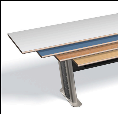
Farb- & Oberflächengestaltung. Color & tabletop variations.