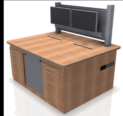
Verbindungselemente. Intermediate elements.