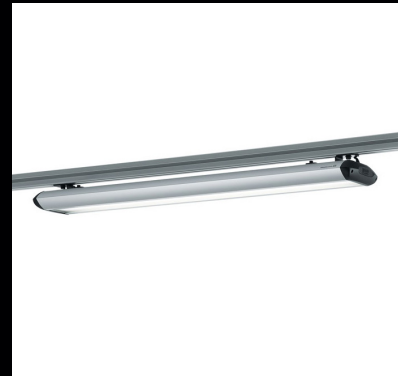
Beleuchtungselemente. Lighting elements.

Weitere Informationen unter - For further information visit www.bfe.tv .