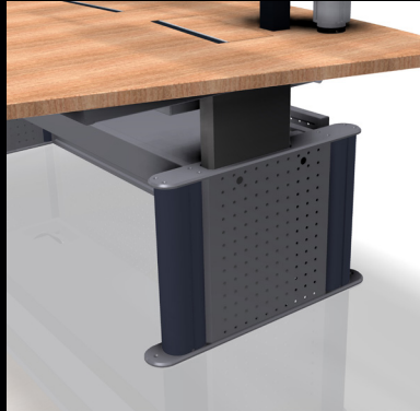
Individuelle Seitenteile. Custom side panels.